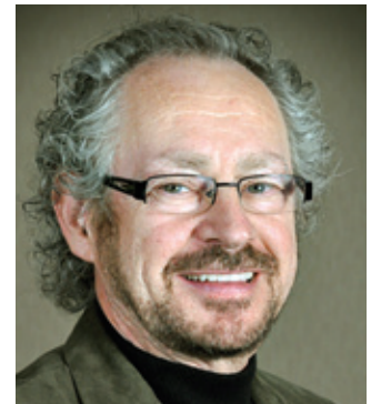
Le président du RPCU