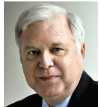
Le directeur général du RPCU