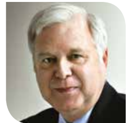
Le directeur général du RPCU