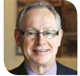
Le président du RPCU

Encore cette année, le congrès RPCU sera une occasion exceptionnelle de réseautage, d'apprentissage et de formation pendant trois jours, et un rendez-vous exaltant pour les membres des comités des usagers et de résidents de partout au Québec! Soyez au rendez-vous vous aussi. Ce congrès est votre congrès.