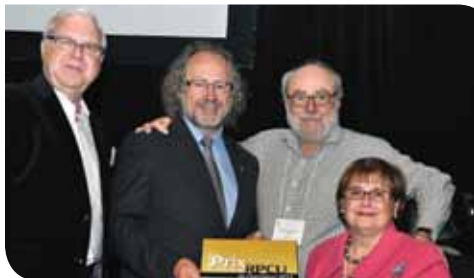
Comité de l'année: Le comité des usagers du CUSM

Regroupement provincial des comités des usagers | 10 ans