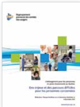
Des enjeux et des parcours difficiles pour les personnes concernées

En décembre 2012, le RPCU publiait un état de situation sur l'hébergement pour les personnes en perte d'autonomie au Québec.