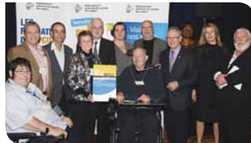
Comité de l'année: Le comité des usagers du CSSS Jeanne-Mance et le comité de résidents du Centre d'hébergement du Centre-Ville-de-Montréal