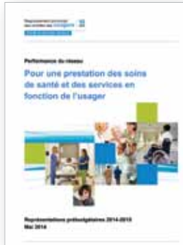
Pour une prestation des soins de santé et des services en fonction de l'utilisateur, mai 2014

Le RPCU présente régulièrement des mémoires lors de commissions parlementaires et diverses consultations.