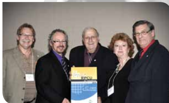
Le comité des usagers de l'Hôpital Maisonneuve-Rosemont