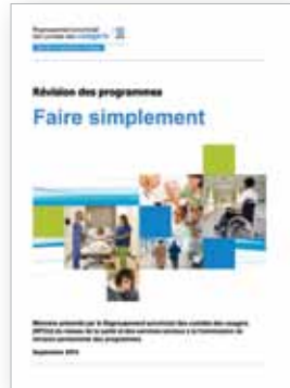
Faire simplement, septembre 2014