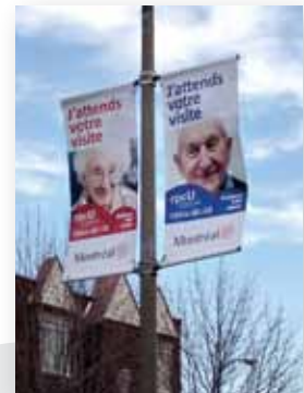
Oriflammes dans les rues de Montréal