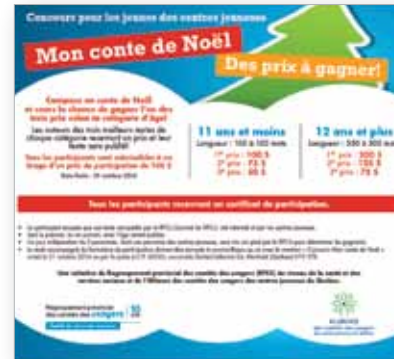
Promotion du concours

En collaboration avec l'Alliance des comités des usagers des centres jeunesse, le RPCU lançait un concours Mon conte de Noël en septembre 2014.