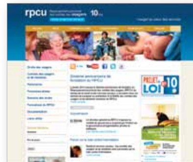
Site Internet du RPCU

Le site www.rpcu.qc.ca offre une foule d'informations sur les droits des usagers, sur divers sujets relatifs à la santé et aux services sociaux et sur les comités des usagers et de résidents.