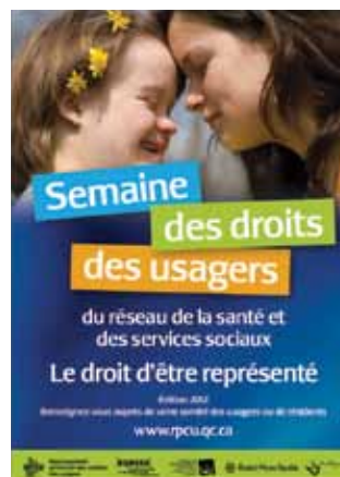
Affiche de la campagne 2012.

La Semaine des droits des usagers du réseau de la santé et des services sociaux est l'un des dossiers privilégiés du RPCU puisqu'il constitue un excellent moyen pour soutenir directement les membres des comités des usagers et de résidents qui souhaitent renseigner les usagers de leur établissement sur leurs droits et mettre en valeur le travail réalisé par leur comité. Voir le point suivant.